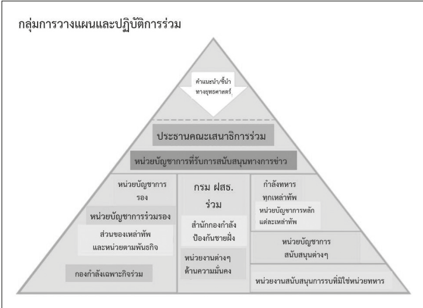
รูปที่ ๔ กลุ่มการวางแผนและการปฏิบัติการร่วม (Joint Planning and Execution Community)

๔. ระบบการวางแผนและปฏิบัติการที่สามารถปรับตัวได้ (Adaptive Planning and Execution System: APEX) APEX เป็นระบบที่ได้รวมเอา นโยบายร่วม, กระบวนการต่างๆ, ขั้นตอนต่างๆ และการรายงาน โดยทำงาน บนเทคโนโลยีทางการสื่อสารและเทคโนโลยีสารสนเทศ ซึ่งใช้งานโดย กลุ่มการวางแผนและปฏิบัติการร่วม (Joint Planning and Execution Community: JPEC) เพื่อตรวจสอบ วางแผน และดำเนินการในการระดม สรรพกำลัง การเคลื่อนย้ายกำลัง การใช้กำลังรบ การดำรงสภาพ การวาง กำลังใหม่ (redeployment) และกิจกรรมต่างๆ ในการเลิกระดมสรรพกำลัง (demobilization) ที่เกี่ยวข้องกับการปฏิบัติการร่วม